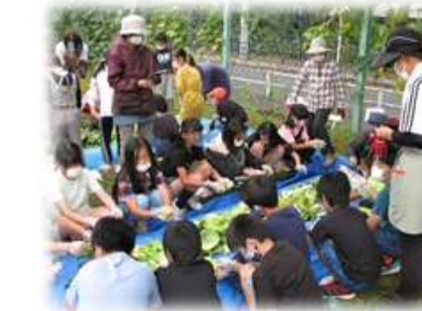
学級園活動(めぐみネット羽村の方々)