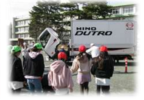
日野自動車出前授業