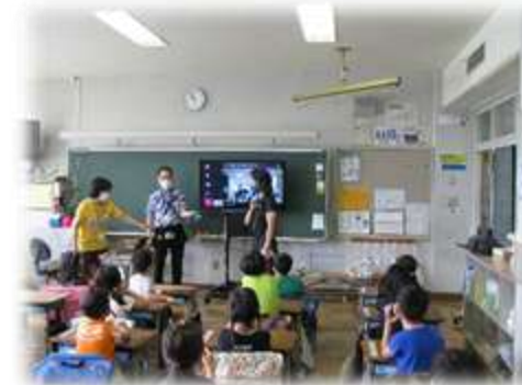
羽村特別支援学校との交流