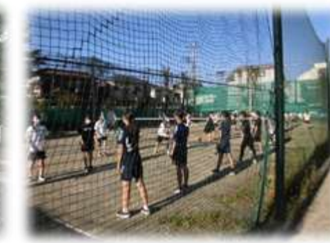
中学校部活動体験