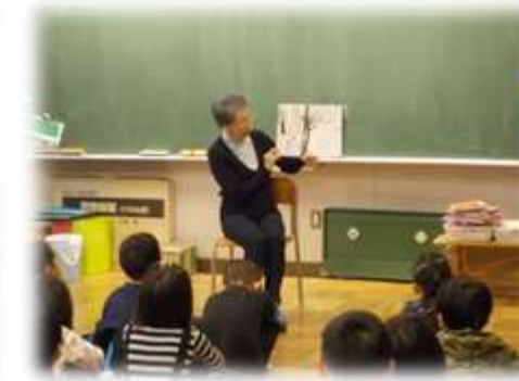
ボランティアによる読み聞かせ