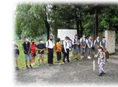
中学校とのあいさつ運動