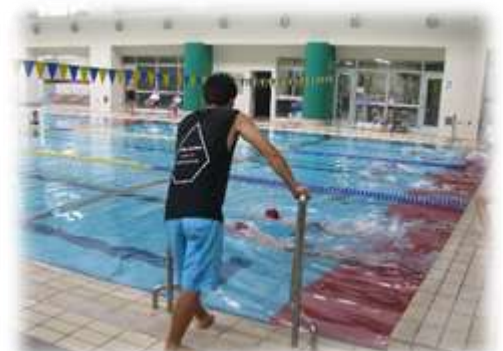
スイミングセンターでの水泳