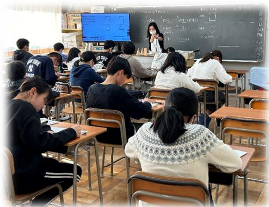
数学の体験授業の様子

「小中一貫教育」の一環として、羽村第一中学校区の3つの小学校（小作台小、羽村西小、羽村東小）の6年生が集まり、中学校の授業を体験しました。事前に6年生に受けてみたい授業の希望を取り、自分の興味がある授業（国語・数学・理科・美術・保健体育・家庭・技術）を受けました。また、生徒会の先輩から学校紹介をしていただき、部活動見学をすることもできました。中学校の雰囲気を知る良い機会となりました。6年生からは「中学校の進学が楽しみになった」という声が聞かれました。