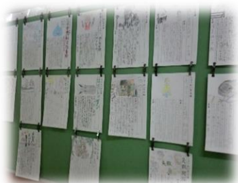
図書室前のクラス代表 「おすすめの本」カード

なったのか、どんな本が紹介されているのか興味津々で図書室前に集まってきます。本を紹介しあうことを通して、読書の幅を広げ、本をより身近に感じられるようになっています。