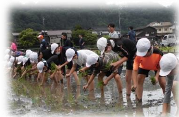
田植え体験：根がらみ前水田

羽村市内の5年生が根がらみ前水田で田植えを行いました。農業委員の方々や小作地区委員会の方々の指導のもと、横一列に並んで丁寧に苗を植えました。活動を振り返った子供たちは「農家の方の大変さを知った。」「秋の田んぼが楽しみ。」と言っていました。とても貴重な体験になりました。学校では、バケツに稲を植えて育てていきます。