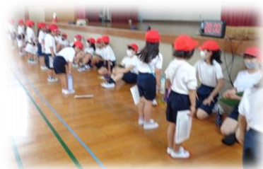
6年生に補助をしてもらう1年生

6月上旬、体力テスト（50m走・20mシャトルラン・握力・上体起こし・長座体前屈・ソフトボール投げ・反復横跳び・立ち幅跳び）を行いました。高学年が低学年を支える体制のもと（1年生は6年生に、2年生は5年生に数を数えたり、足をおさえてもらったりしました）どの子も精一杯頑張りました。