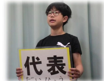
テレビ放送の様子

各委員会の委員長になった6年生が、委員会の活動や全校児童へのお願いなどを発表しました。緊張した面持ちで開始を待っていた子供たちでしたが、始まるとどの委員長も原稿を見ないで発表することができ、とても頼もしく立派でした。これから小作台小学校のリーダーとして活躍してくれることを期待します。