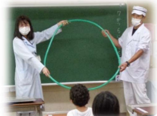
鍋と同じ大きさの「輪っか」

給食センターの栄養士と調理員の方が来校し、1年生に「給食がどのように作られ、運ばれてくるのか」写真を使って話をしてくださりました。話の途中には、実際に使っている大きな「へら」を見せてくれたり、ホースで作った大きな「輪っか」を見せてお鍋の大きさを示し、大きなお鍋で給食を作っていることを教えてくれたりしました。1年生からは「うわ～大きい」と驚きの声があがりました。また、「お残し（残菜）はどうなるのですか。」