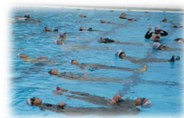
ペットボトルの浮力を体験

5・6年生は、着衣のまま水に落ちた場合の対処の方法について学習しました。着衣で水に入ると思った以上に負荷がかかり、泳ぎにくいことを体験しました。できるだけ長く浮くには、背浮きで手や足をゆっくり動かすこと、ペットボトルなどを使って浮くことを学びました。