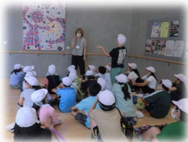
展示作品の鑑賞の様子

プリモホール「ゆとろぎ」で開催された「アート in はむら展」では、地下から屋上まで館内展示場所を回って、たくさんの美術作品を鑑賞しました。初めにクラスごとに一つの作品を「どう見えるか、どう感じるか」等を発表し合って作品の鑑賞をしました。また、グループごとに館内を歩き、感想を言い合ったり、実際に作者の話の聞いたりしながらお気に入りの作品を見つけました。たくさんのボランティアの方々にも支えられ貴重な体験をすることができました。