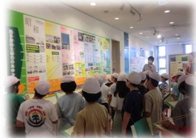
「西多摩衛生組合のあゆみ」 についてパネルで説明

次にリサイクルセンターでは、集められた資源ごみをさらに分別している様子を見学しました。この見学を通して、各家庭での分別の大切さや自分たちにできることを考えるきっかけになりました。