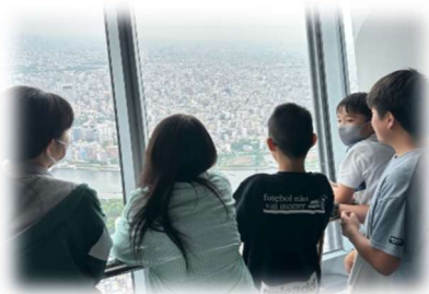
東京スカイツリーにて