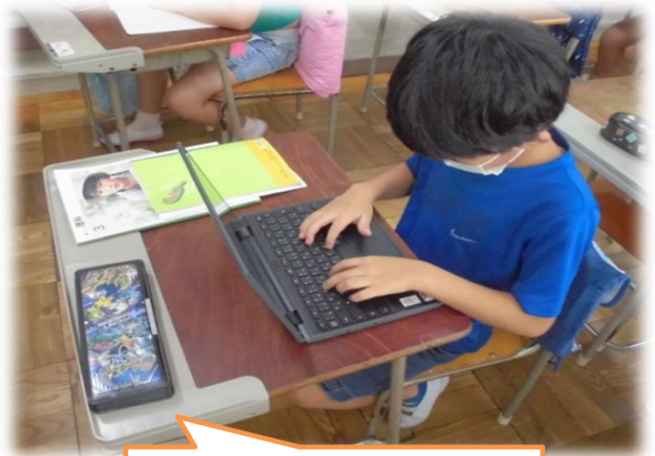
この部分が拡張されています。

児童機を奥行き方向に10cm拡張することにより、ゆとりをもって1人1台端末や教科書、筆記用具等が置けるようになりました。また、落下による1人1台端末の破損事故防止をします。