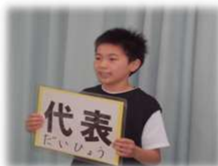
テレビ放送の様子

各委員会の委員長になった6年生が委員会の活動や全校児童へのお願いなどを発表しました。どの委員会の委員長も原稿を見ないで発表することができ、とても頼もしく立派でした。これから小作台小学校のリーダーとして活躍してくれることを期待します。