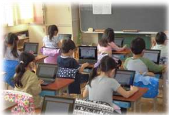
1年生の計算タイム様子

8時15分から全校の活動として、朝の10分間読書をしています。原則、担任も児童と同じように読書をしています。