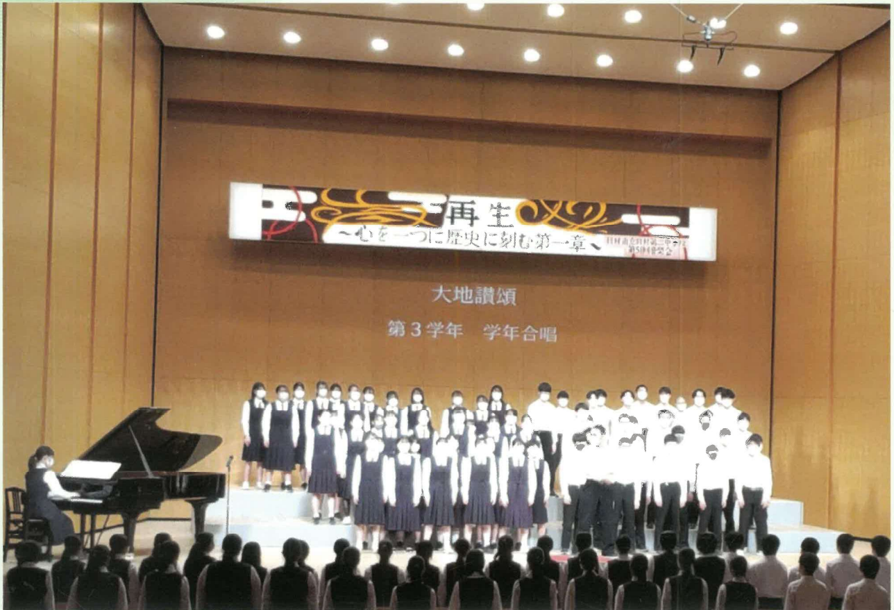
第52回音楽会～ゆとろぎにて～